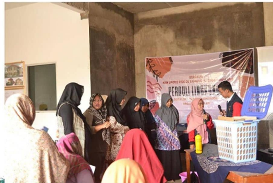
KEGIATAN PROGRAM KERJA WORKSHOP / LOKAKARYA ORGANIK ANORGANIK