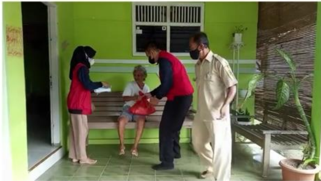
KKN UPGRIS Peduli