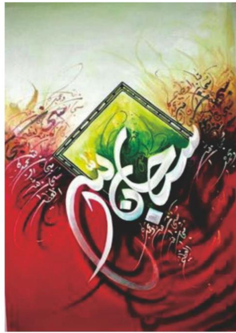
MEDIA : LEMBAR KERJA PADA SOFTWARE APLIKASI UKURAN : A2 (42 x 59,4 cm)