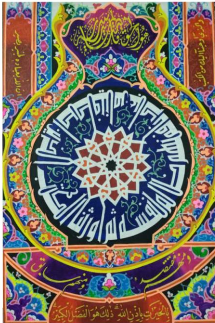
MEDIA : TRIPLEKS DENGAN CAT DASAR WARNA PUTIH UKURAN : 80 x 120 cm