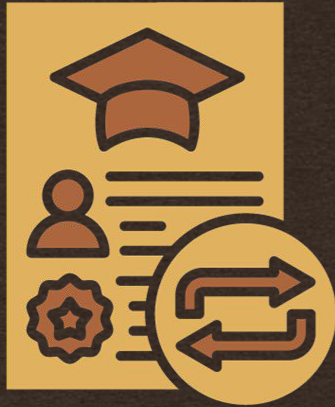
Transfer / Ambil Kredit