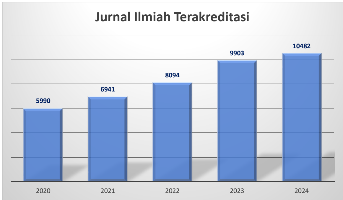
Gambar 1 Jumlah jurnal terakreditasi 2021 sampai 2024